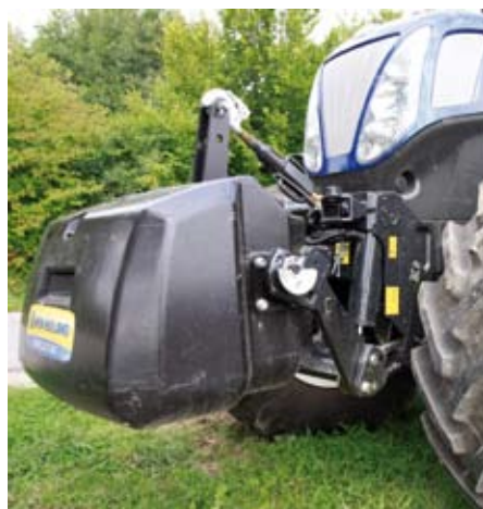
Die integrierte Fronthydraulik mit Fernbedienung hebt maximal 3.785 kg. Ein doppelwirkendes Hydraulikventil vorn ist möglich.

Die wichtigsten Bauteile sind der CommandGrip-Multifunktionsgriff, der gut in der Hand liegt, der Touchscreen-Monitor IntelliView III und das Bedienpanel sowie der Kreuzsteuerhebel für die Hydraulik und die „EHR-Maus“. Die Position von Maus und Joystick wählt der Kunde beim Kauf aus.