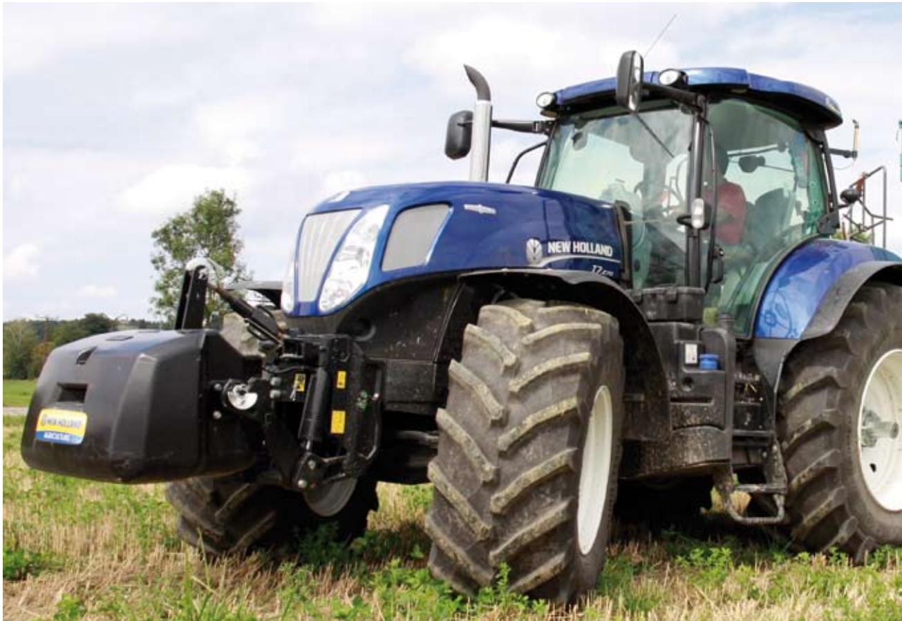
Maximal 269 PS bringt der New Holland T 7.270, hier in der maseratiblaunen Sonderausstattung, auf die Straße.