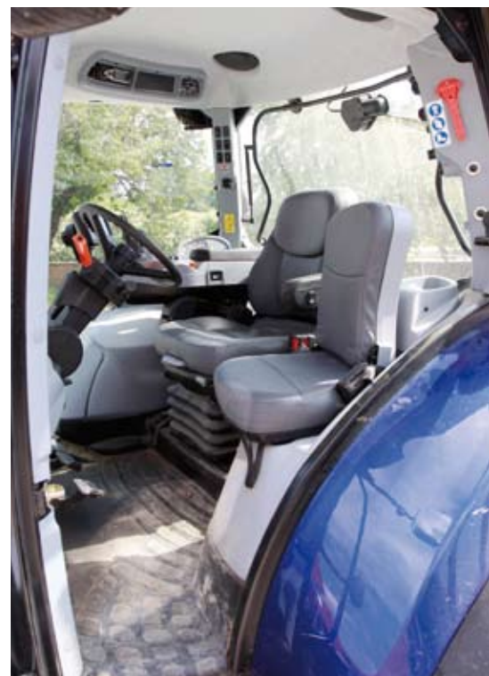
Die Kabine hat einen bequemen Aufstieg und ist mit 69 db(A) angenehm leise. Die Ledersitze sind Sonderausstattung.

Das Getriebe lässt sich fast komplett mit dem Joystick steuern. Steht der in Neutralstellung fährt der Schlepper in der gewählten Geschwindigkeit. Vier Fahrmodi stehen zur Verfügung: auto, Tempomat, Zapfwelle und manuell. Wir sind meist im Auto- oder Tempomatmodus gefahren. Im Automodus kann die Geschwindigkeit über das Fahrpedal oder den CommandGrip-Multifunktionshebel erfolgen. Per Tastendruck lassen sich drei Zielgeschwindigkeiten für vor- und rückwärts anwählen. Die Geschwindigkeit stellt der Fahrer an einem kleinen Scrollrad am Joystick ein. Das ist praktisch und funktioniert gut. Die Zielgeschwindigkeiten entsprechen den Tempomatgeschwindigkeiten. So kann man schnell ohne Rucken zwischen den Geschwindigkeitsbereichen hin- und herschalten und auch die Geschwindigkeiten sind schnell und einfach verstellbar.