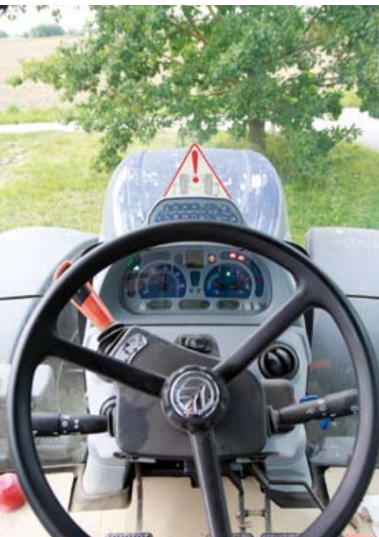
In der Wendeschaltung (oranger Hebel) ist die elektronische Parkbremse integriert, die sich automatisch bei längerem Halt aktiviert.

sorgt so für einen bequemen Aufstieg. Mit dem AutoCommand-Getriebe ausgestattet, ist die Sidewinder-Armlehne serienmäßig. Damit zieht sich das gelungene Bedienkonzept mit der Armlehne nun durch fast alle Baureihen.